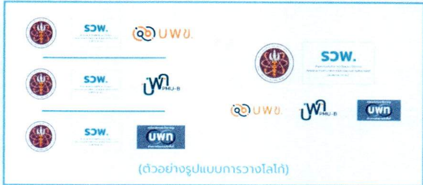
(ตัวอย่างรูปแบบการวางโลโก้)